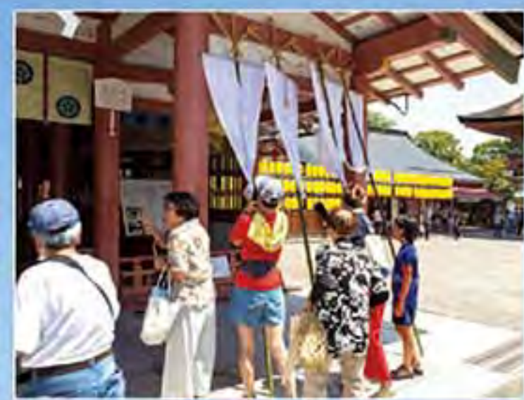
市江車 布銚奉納 市江車の銚持が神社に奉納した布銚のしずくを患部につけると病気やケガが治るという言い伝えがあります。