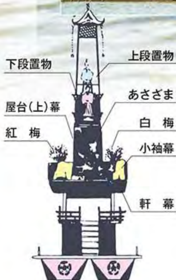
津島車楽舟 (高さ約14m)

池の中ごろまで進むと、先頭の市江車から十人の銚持(未婚の男子)が布銚を背負い池に飛び込み、御旅所まで泳ぎ着くと、神輿に拝礼し神社まで走り抜け神輿還御の先祓いとして道中を祓い清め神前に布銚を奉納します。