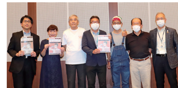
▲バスコース「愛知県観光協会賞」を受賞した「現代版ノブナガ・大うつけに突撃!夢は尾州にあり!」チーム