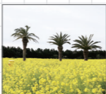
渥美半島菜の花まつり

メイン会場の伊良湖菜の花ガーデンでは、空中廊下「菜の花ランウェイ」や「幸せの黄色いポスト」などインスタ映えするスポット満載。売店「菜の花や」や土日にはキッチンカーも並びます。