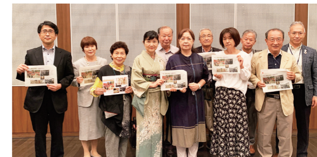
▲まちあるきコース「愛知県観光協会賞」を受賞した「津島『野点大茶会+大正ロマン』おもてなしの心 息づく町 津島で、奔放な愛に生きた二人の『アキコ』にふれる旅」チーム