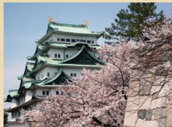
「日本百名城」に選ばれ、国の特別史跡にも指定されている名古屋城。別名「金鯱城」とも呼ばれています。

名古屋城は、日本の「三大名城」のひとつに挙げられています。国指定特別史跡として、隅櫓や城門、美術品など、多くの重要文化財があり、しかも、国指定名勝の二の丸庭園を有する名古屋城は、今や国際的な観光地といえます。 歴史をたどると、永正一五年(一五一八)以降に、今川氏が大城郭の前身として