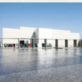
挙母城址にある豊田市美術館。城址のイメージとは正反對の近代的な美術館です。