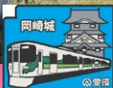
岡崎2コース制覇賞