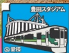
豊田2コース制覇賞