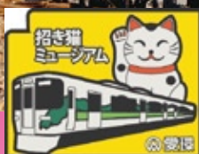
瀬戸2コース制覇賞