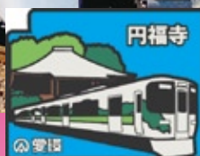
春日井1コース制覇