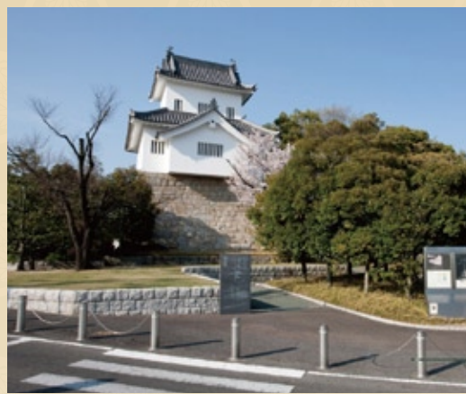
豊田市中心部のすぐ西南の小高い丘にある挙母城址公園。(写真は再建された隅櫓)