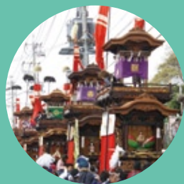
常滑 春の山車まつり【常滑市】