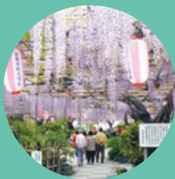
広藤園藤まつり【碧南市】