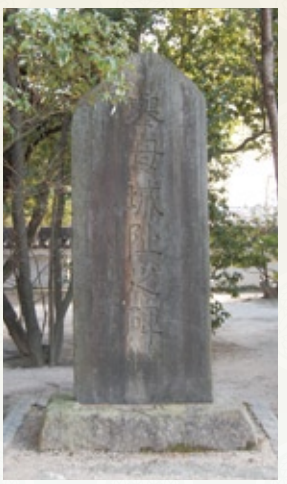
挙母城は、江戸幕府が一国一城令を出した以降に築城された、珍しい城です。(写真は挙母城址之碑)