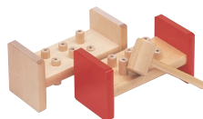
ハンマートイ (フィンランド)