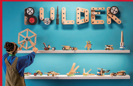
ブリオ ビルダー (スウェーデン)