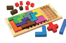
カタミノ (フランス)