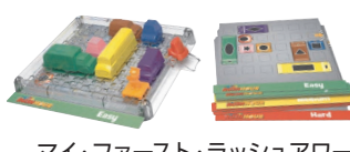
マイ・ファースト・ラッシュアワー (アメリカ)