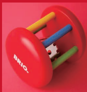
ブリオ 知育玩具 (スウェーデン)