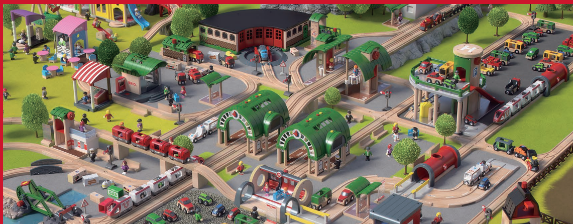
ブリオ レールウェイ (スウェーデン)