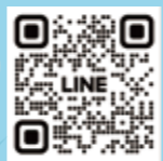
「白鳥庭園」公式LINEはこちら!