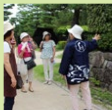
◎協力：白鳥庭園白游会